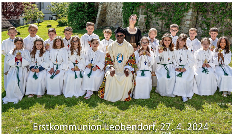
Erstkommunion Leobendorf, 27. 4. 2024