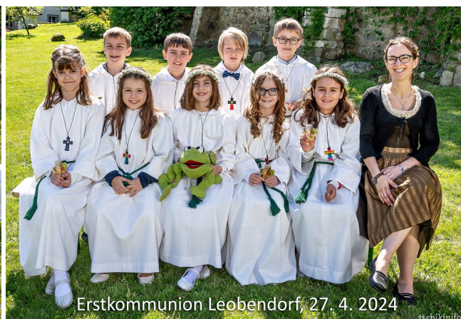
Erstkommunion Leobendorf, 27. 4. 2024