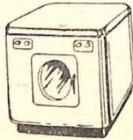
BENBIX — vollautomatische Waschmaschine