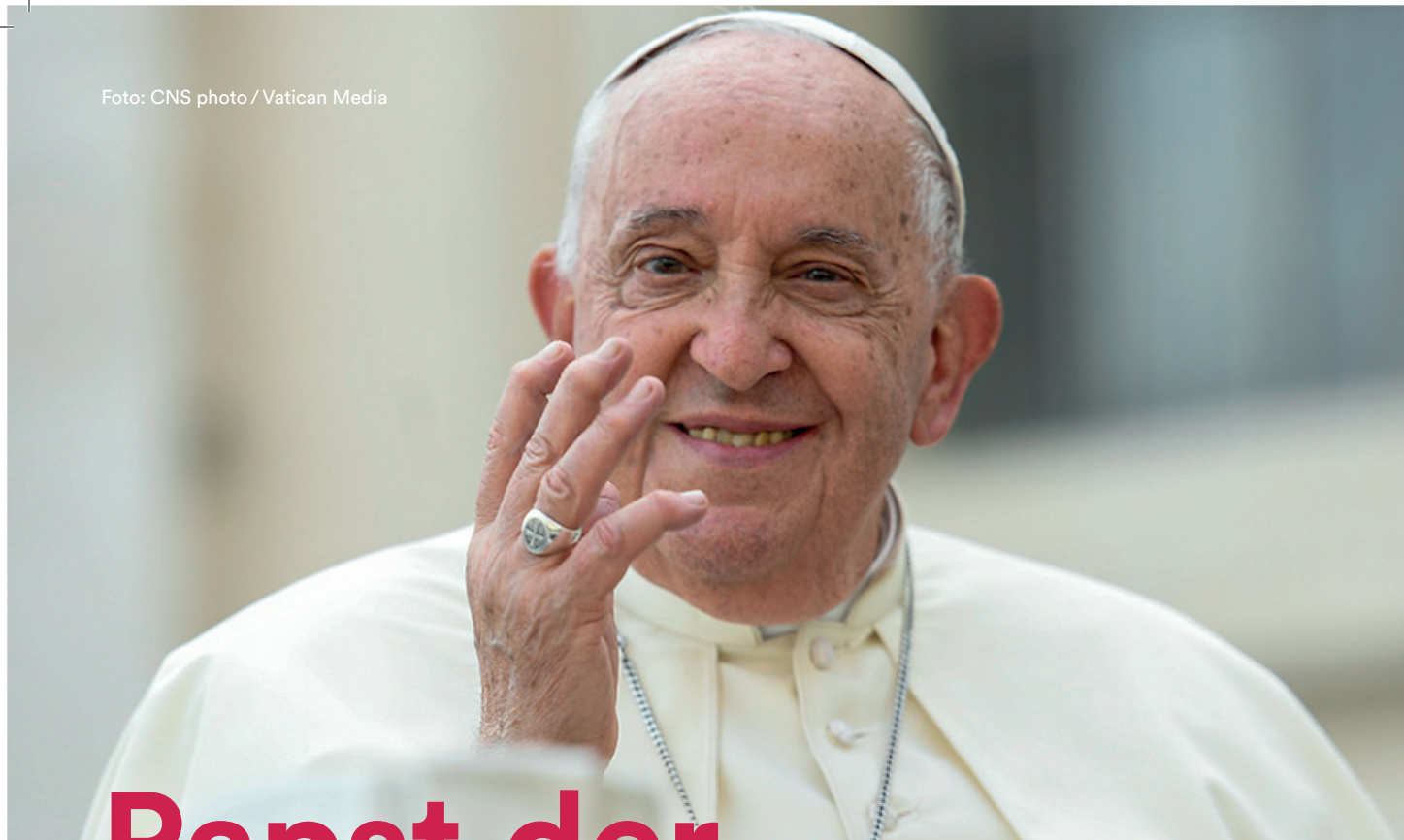
↑ Papst Franziskus begrüßt Besucher vor der Generalaudienz auf dem Petersplatz.