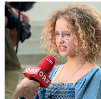
Eine junge Besucherin im ORF-Interview →