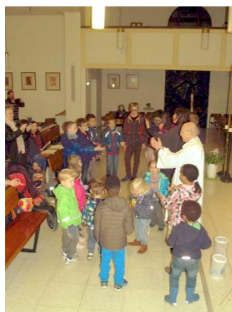
Fest des Hl. Martin

Ein herzliches Dankeschön allen, die zum Gelingen unserer Veranstaltungen beigetragen haben!