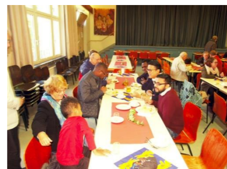
Sonntag der Völker