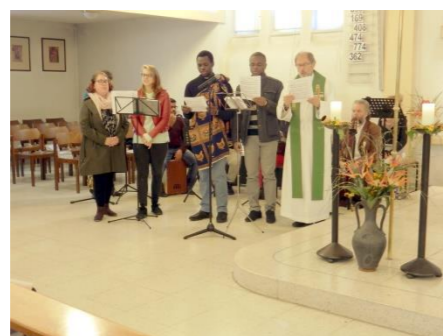
Sonntag der Völker