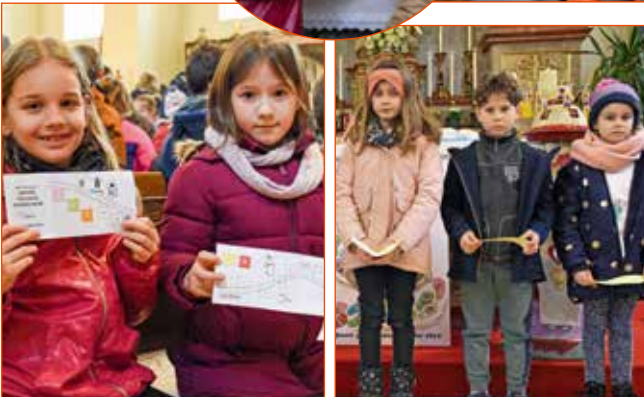
Die Kinder wirkten aktiv an ihrer Pfarrverbandsmesse mit.

Der Pfarrverband feierte die Erstkommunionvorbereitung als gemeinsames Fest aller Pfarren.