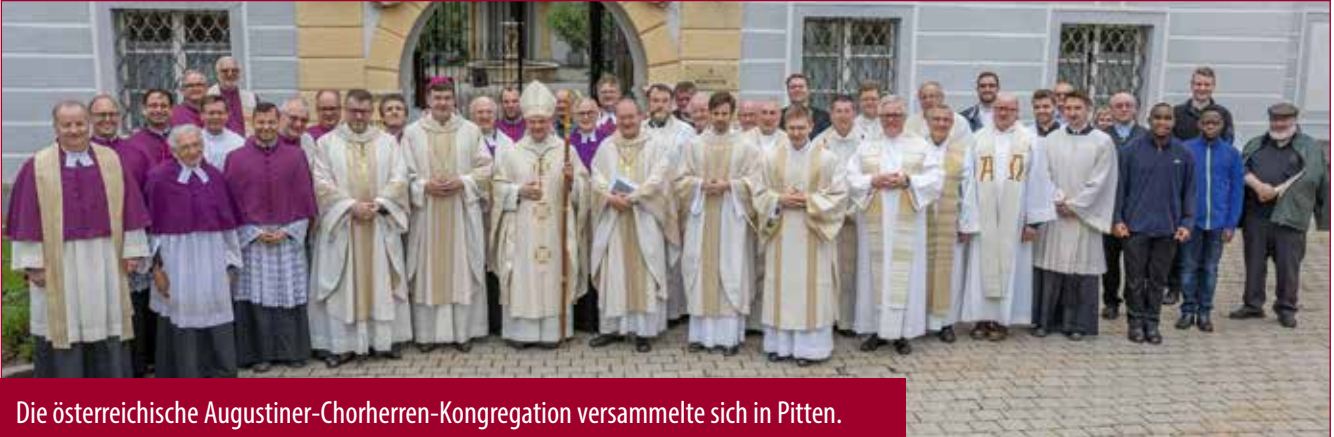
Die österreichische Augustiner-Chorherren-Kongregation versammelte sich in Pitten.

Der Chorherrentag der Augustiner-Chorherren findet alle Jahre am Dienstag nach Pfingsten statt. Heuer führte er die Pröpste und Chorherren aus Österreich und Südtirol nach Pitten und die Region.