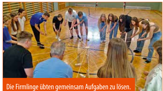
Die Firmlinge übten gemeinsam Aufgaben zu lösen.

Der Empfang des Heiligen Geists ist damit gleichermaßen auch ein Auftrag an die Jungen Menschen, aktiver Baustein einer lebendigen Gemeinschaft zu sein. Wie das aussehen kann, erfuhren sie etwa beim Firmfest in Walpersbach. Einen ganzen Tag lang wurden dort alle Firmkandidaten aus dem Pfarrverband auf unterschiedlichste Weise in