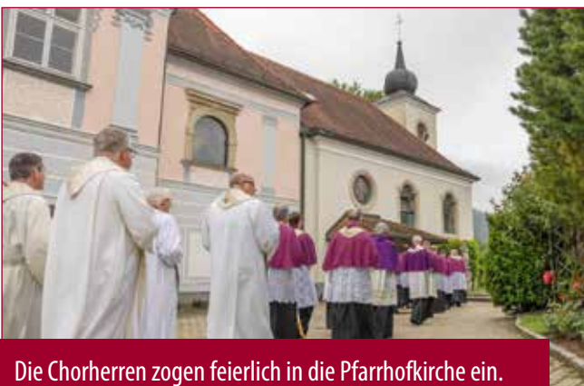
Die Chorherren zogen feierlich in die Pfarrhofkirche ein.