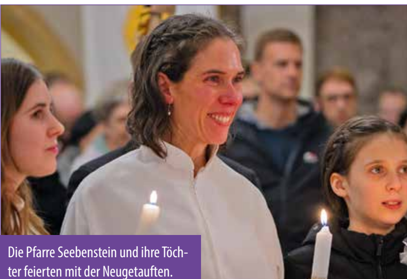
Die Pfarre Seebenstein und ihre Töchter feierten mit der Neugetauften.