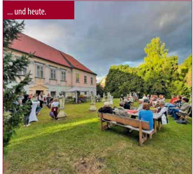
... und heute.

Während der Corona-Pandemie wurde der Pfarrhofgarten in Pitten zur „Kirche unter freiem Himmel“ und gewann an Bedeutung, etwa für Maianachten und Gebetsgruppen.