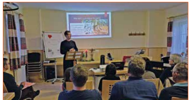
Die Veranstaltungsreihe findet in Seebenstein statt.