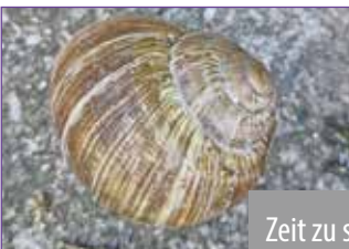
Zeit zu staunen.