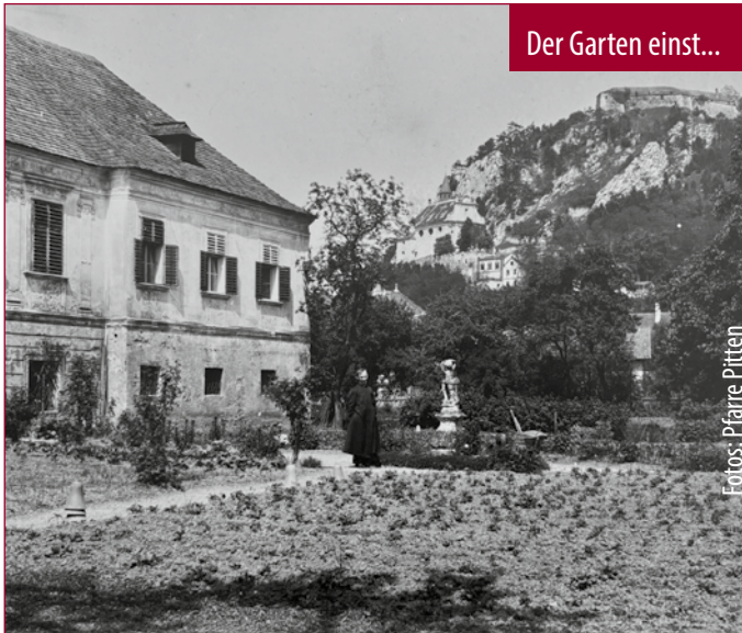
Der Garten einst...

Um gestärkt durch persönliche, gesellschaftliche oder weltpolitische Krisen zu kommen, braucht es Räume des Kräfte-Sammelns. Der Pfarrhofgarten in Pitten will ein solcher spiritueller Ort des Innehaltens und Neu-Ausrichtens sein. Zahlreiche Angebote zeugen davon.