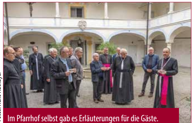
Im Pfarrhof selbst gab es Erläuterungen für die Gäste.