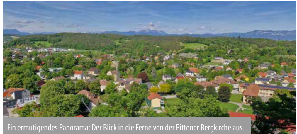
Ein ermutigendes Panorama: Der Blick in die Ferne von der Pittener Bergkirche aus.

Ganz anders bei schönem Wetter oder bei einer ausgiebigen Rast auf dem Gipfel eines Berges: Der Blick schweift in die Ferne, ich kann wahrnehmen, was beim anstrengenden Aufstieg nicht möglich war, ich atme durch und staune über die Wunder der Natur und die Pracht der Schöpfung. Aus dem verzweifelten Fokus wird ein herrliches und ermutigendes Panorama. Das erhobene Haupt ist in der Bibel die Haltung des Erlösten und freien Menschen.