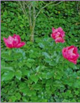
Naturoase mitten im Ort.