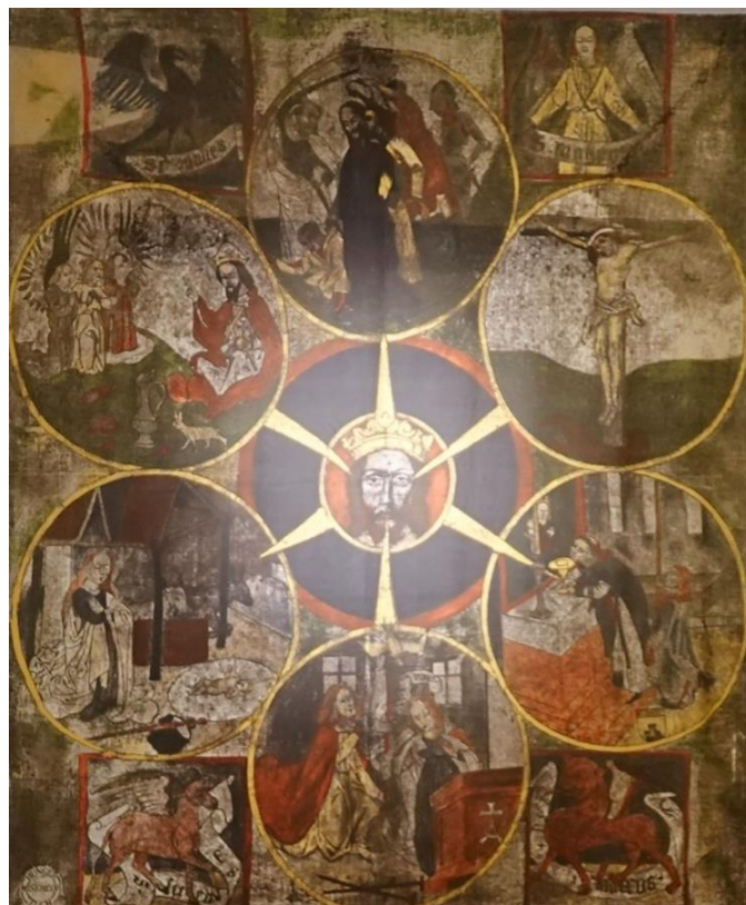
Fastentuch in der Pfarrkirche Sittendorf