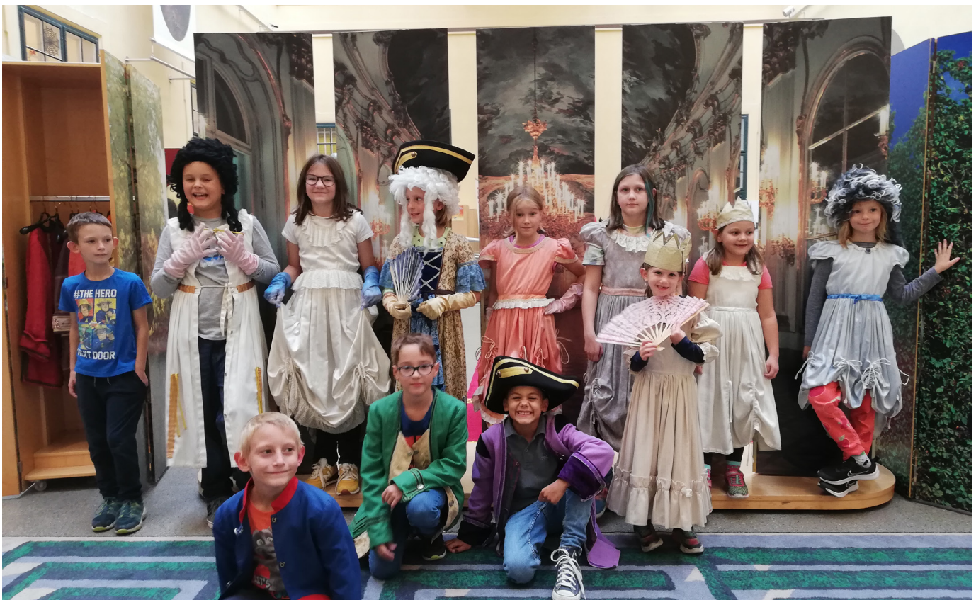
DER JAKOUSBOTE 4/2022

erkundeten wir das Kindermuseum mit Rätseln, vielen Gegenständen zum Befühlen, Selber-Ausprobieren und Experimentieren und auch einigen Spielen, die die Kinder selbstständig auswählen und für sich entdecken konnten. Es machte ihnen sehr viel Spaß und bot im Gegensatz zu „klassischen“ Museen ein Lernen durch eigenes Handeln. Raum für Raum tauchten