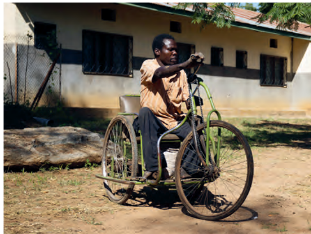
Fahrradaktion 2020 im Kongo

indem sie die kraftlosen Beine nachzogen. Insgesamt 65 Dreiräder, welche aus einer Spezialkonstruktion aus zwei handelsüblichen Fahrrädern zusammengebaut sind, sollten es werden. Diesen Herzenswunsch konnte die MIVA erfüllen!