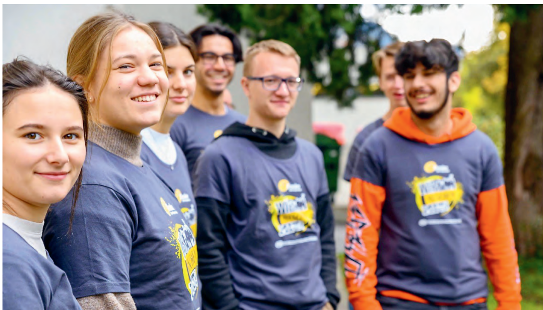
72 Stunden ohne Kompromiss

den wurden abgesagt bzw. nicht abgehalten. Betroffen davon war zum Beispiel die bekannte österreichweite gemeinnützige Veranstaltung "72 Stunden ohne Kompromiss", welche in diesem Jahr inklusive Covid-19 Konzept nachgeholt wird. Abseits von Veranstaltungen gibt es natürlich vieles, das normalerweise in der KJ auf Pfarrebene stattfindet und nicht wie gewohnt weitergeführt werden konnte. Dennoch, wo es ging, wurde auf online geschwitched. Auch unsere österreichweite Bundeskonferenz mit über 70 Personen fand als dreitägiges Event inklusive Wahl via Zoom statt.