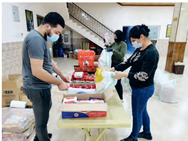
Corona-Soforthilfe: Ehrenamtliche bereiten Lebensmittelpakete für bedürftige Familien vor

Wir freuen uns über einen neuen Spendenrekord im Jahr 2020 mit erstmals mehr als 1,13 Mio. Euro an Spenden in einem Jahr. So war es uns möglich, 65 Projekte mit rund 948.000 Euro in unseren Schwerpunktländern im Nahen Osten erfolgreich zu realisieren und vielen Menschen zu helfen.