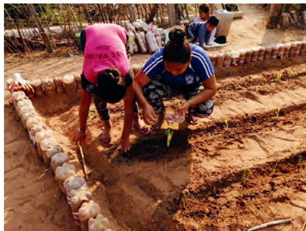
Anlegen eines Schulgartens in Tentaguazu

Jene Kinder in den verstreut liegenden Bauernschaften, die normalerweise bei Gastmüttern untergebracht sind, wurden alle zwei Wochen von Lehrer*innen besucht. Neue Unterrichtsmaterialien wurden übergeben und die bearbeiteten Materialien vom vorausgegangenen Besuch eingesammelt. Dabei konnten Fragen der Kinder geklärt und Erläuterungen gegeben werden.