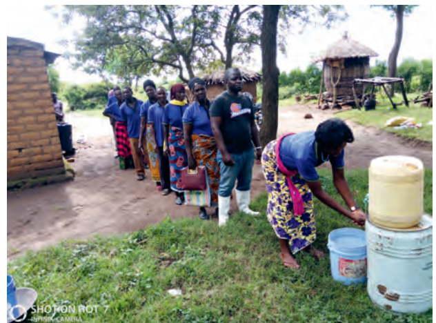
Frisches Wasser ist eine kostbare Ressource