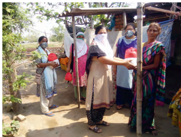
Lebensmittelverteilung in Indien

Die Bereitstellung von Lebensmitteln und Hygiene-/Medizinartikeln und die Sensibilisierung waren die Hauptmerkmale der Projekte. Die Projekte haben sich an jedem Ort auf einzigartige Weise entwickelt: Die SVD in Togo legte 4000 km zurück, um Nahrungsmittel und die Gesundheitskampagne der Regierung in die abgelegenen Dörfer, die typischen SVD-Pfarreien, zu bringen. Die Community Welfare Society (CWS) Rourkela startete die Hilfsarbeit mit der Zusage von € 6 000,00 und stellte viele Pakete mit frischen Lebensmitteln sowie 65000 selbstgekochte Mahlzeiten zur Verfügung. Die SVD, SSps, Sozialanimatoren, Freiwillige, Behörden, NGOs, Schulen und Einheimische schlossen sich an. Wir müssen an die 2 Fische und 5 Brote denken.