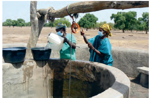
Wasserschöpfen im Senegal

die ländliche Bevölkerung verteilt, um die Menschen vor einer Infektion zu schützen. Gleichzeitig konnten MitarbeiterInnen der Partnerorganisation vor Ort die Menschen aufklären und sensibilisieren, wie sie sich vor dem Virus schützen können. Die Caritas unterstützte auch Nothilfemaßnahmen gegen Armut und Hunger. In Syrien zum Beispiel haben wir Bargeldzahlungen an Familien geleistet. Damit konnten sie ihren Bedarf an Grundnahrungsmitteln, Hygieneartikeln und Wohnkosten decken. Regelmäßig wurden auch Nahrungsmittelerationen verteilt. Die Pakete halfen jenen, die durch Corona jede andere Einkommensmöglichkeit verloren hatten. Eine besonders vulnerable Gruppe war außerdem die der geflüchteten oder intern vertriebenen Menschen: zum Beispiel im Nahen Osten, in Griechenland, am Balkan und in Krisenregionen in Afrika war die Unterstützung der Caritas überaus dringend und überlebensnotwendig.