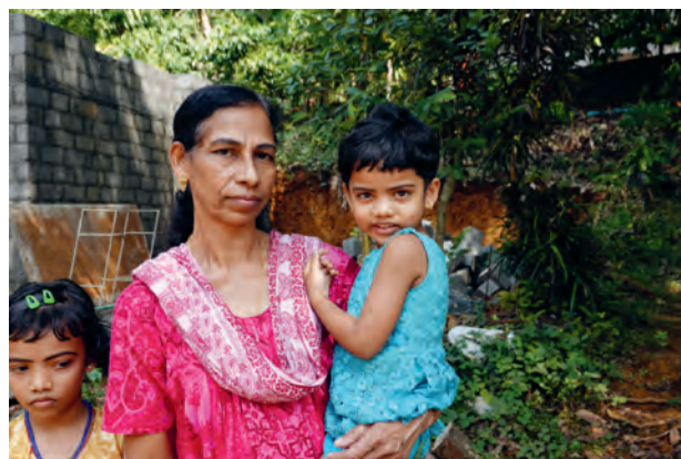
Mutter mit Kindern in Indien. Unterstützung von Familien durch Förderung der landwirtschaftlichen Entwicklung, um deren Lebensgrundlage zu verbessern.

Für die Unterstützung der Pfarren für die Sammlung 2021 stellt das Hilfswerk Fastenaktion Informationsmaterial bzw. Beschreibungen von Projekten und einigen Tipps zur Durchführung wie „Fastensuppe im Glas“, Aktion „Solidaritätseuro“, Suppenwürfel gegen Spende, Fastenwürfel für Familien, Schulen, Kinder- und Jugendgruppen zur Verfügung. Dies geschieht mit den genannten Kooperationspartnern.