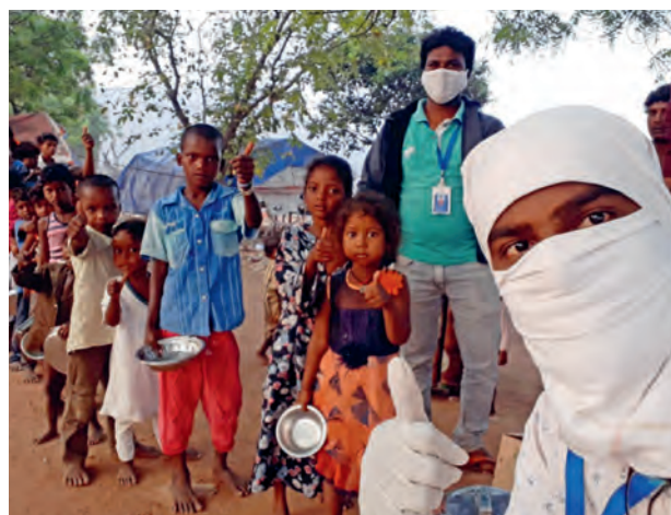
Die Corona Pandemie macht sowohl Nothilfe in Form von Nahrung und Hygienematerial, als auch strukturelle Veränderungen notwendig.

Aus der Pfarre Mbare in Simbabwe berichtet P. Nigel SJ von den Schwierigkeiten: Abstand halten, wenn 10 Personen auf engstem Raum zusammenleben und das Transportmittel zur Arbeit ein überfüllter Minibus ist, ist unmöglich. Über unser globales Ordensnetzwerk versuchen wir, beide Aspekte einer weltweiten Pandemie im Blick zu haben: wir unterstützen die Arbeit und Hilfsaktionen unserer Partner auf lokaler Ebene und wir arbeiten auf globaler Ebene zusammen. Koordiniert von der Leitung in Rom wurde eine gemeinsame Datenbank der weltweiten Aktivitäten entwickelt und die Verantwortlichen der sozialen Werke für die verschiedenen Kontinente sind in regelmäßigem Austausch.