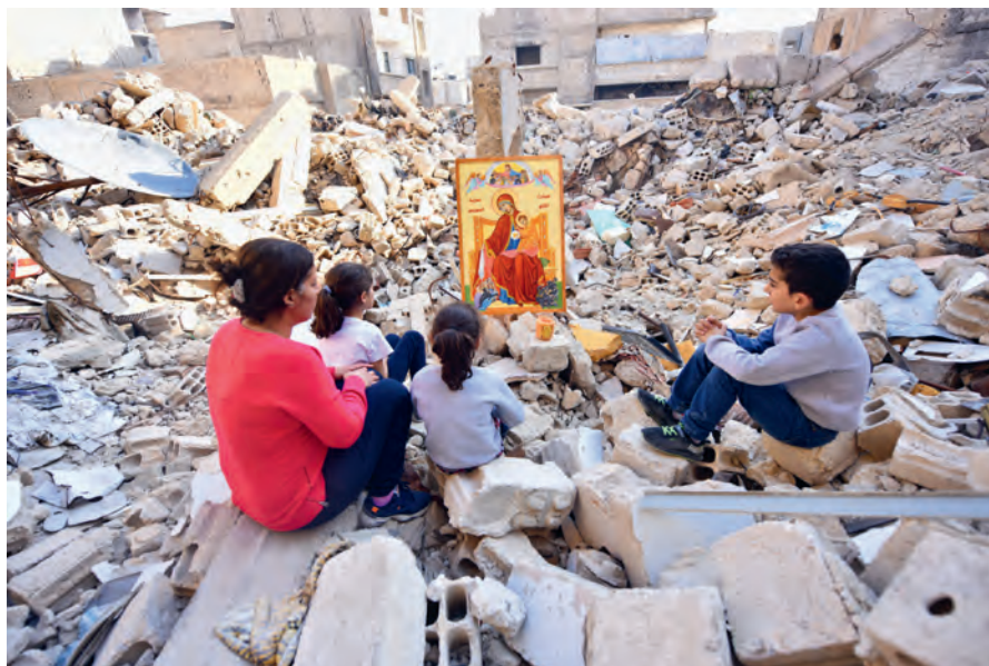
Kinder in Syrien