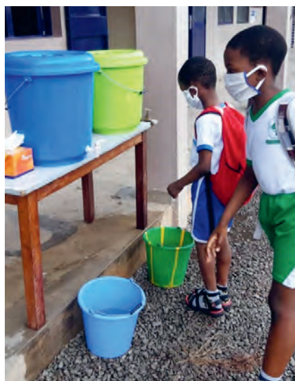
Benin: Handhygiene der Kinder entsprechend der Corona-Auflagen

Dieser Prozess hatte zum Ziel, aus der kirchlichen EZA-Arbeit in Vorarlberg ein gemeinsames Zukunftsbild zu schaffen, das von Effizienz und Effektivität geprägt ist, und wurde partizipativ durch Einwirken der bisherigen Mitgliedsorganisationen gestaltet.