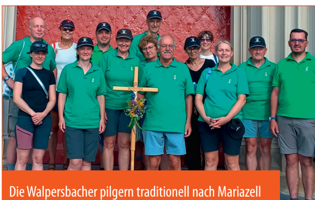
Die Walpersbacher pilgern traditionell nach Mariazell