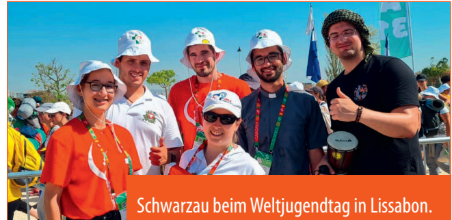
Schwarzaun beim Weltjugendtag in Lissabon.

Freude bereitete der Gruppe aus Seebenstein im