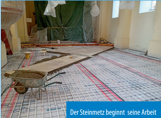
Der Steinmetz beginnt seine Arbeit