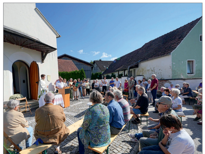
Im September wurde 60 Jahre Kapelle Guntrams gefeiert.