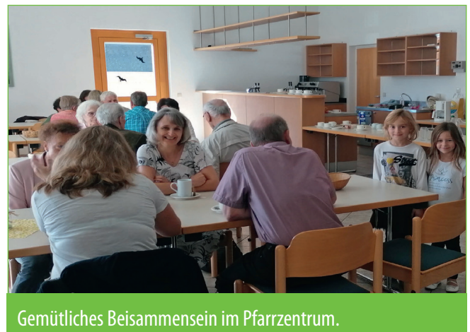
Gemütliches Beisammensein im Pfarrzentrum.