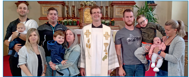
Die ersten Familien bei der „Eröffnung des Weges zur Taufe“. Ende Oktober begann der zweite Kurs.