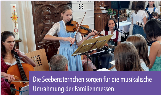
Die Seebensternchen sorgen für die musikalische Umrahmung der Familienmessen.

Der Familiengottesdienst ist immer eine ganz besondere Messe. Sie findet seit zwei Jahren regelmäßig am ersten Sonntag des Monats um 10 Uhr in der Pfarrkirche Seebenstein statt.