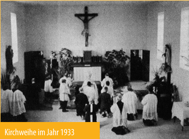
Kirchweihe im Jahr 1933

Wer die Geschichte der Entstehung der Antoniuskirche an der Hauptstraße im Zentrum von Bad Erlach liest, kommt wohl aus dem Staunen nicht heraus und wird sich fragen: „Wie ist so etwas überhaupt möglich?“ Beeindruckend ist es allemal, dass mitten in der wirtschaftlich so schwierigen Zwischenkriegszeit, in der sich die Anfänge des Nationalsozialismus bereits wie ein bedrohlicher Schatten über Österreich und Europa breiteten, die Idee eines Kirchenbaus überhaupt auf fruchtbaren Boden fiel.