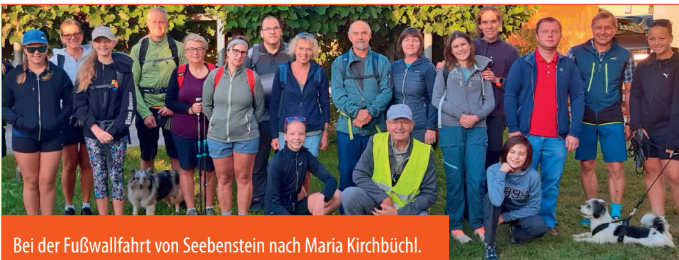
Bei der Fußwallfahrt von Seebenstein nach Maria Kirchbüchl.