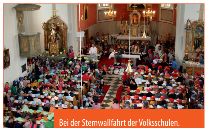
Bei der Sternwallfahrt der Volksschulen.