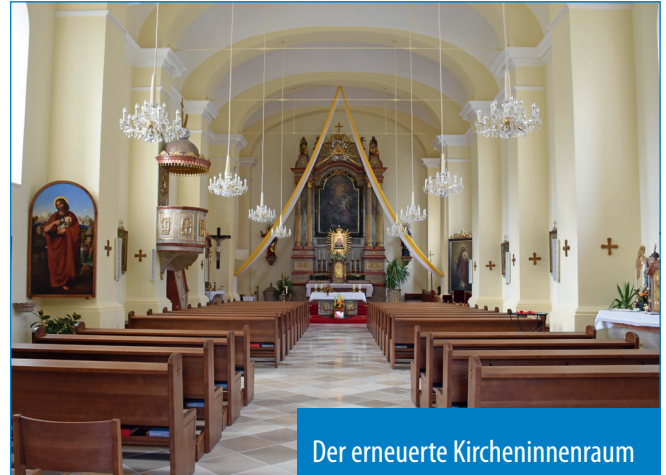
Der erneuerte Kircheninnenraum