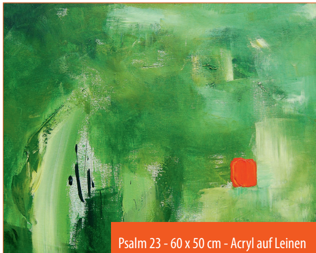
Psalm 23 - 60 x 50 cm - Acryl auf Leinen

Der eigentliche Lebenswegbegleiter ist und bleibt dabei immer Gott selbst“, meint Sr. Heidrun, die ihre eigenen Lebens- und Glaubenserfahrungen in Bildern und Texten ausdrückt.