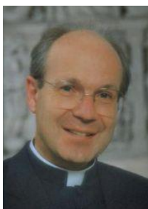
Erzbischof Kardinal Dr. Christoph Schönborn

"... ein Schiff ist nicht gebaut, um im Hafen liegenzubleiben ..."