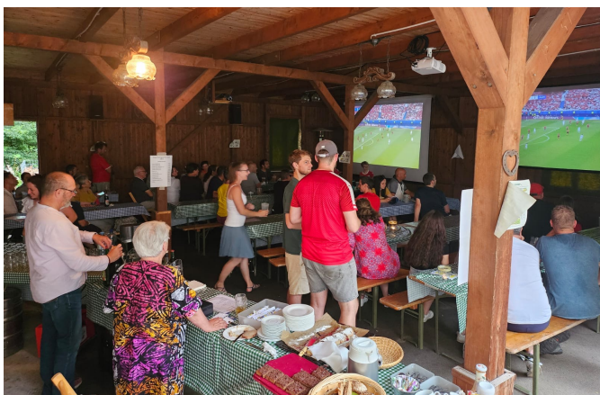
Fußball-EM im Pfarrstadl