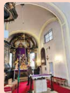
Kirchenputz Danke an alle Helfenden!