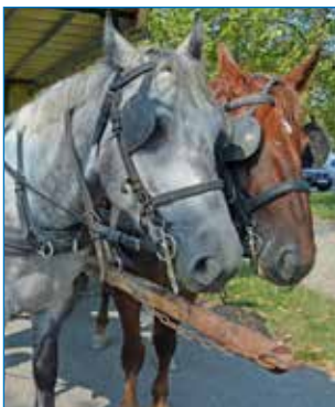
Kutschentour beim Ausflug

Anfang September lud die Pfarre Schwarzau zum Pfarrausflug an den Neusiedler See ein. Ein ausgebuchter Bus machte sich auf den Weg ins Burgenland, wo in der Pfarre Mörbisch Messe gefeiert wurde. Im Anschluss erlebten die Teilnehmer einen gemütlichen Tag rund um und auf dem Neusiedlersee