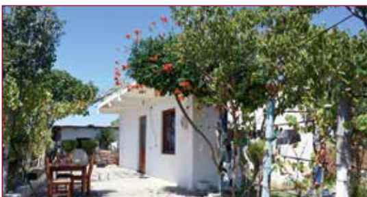
Leben in Häusern statt in Baracken dank Spenden