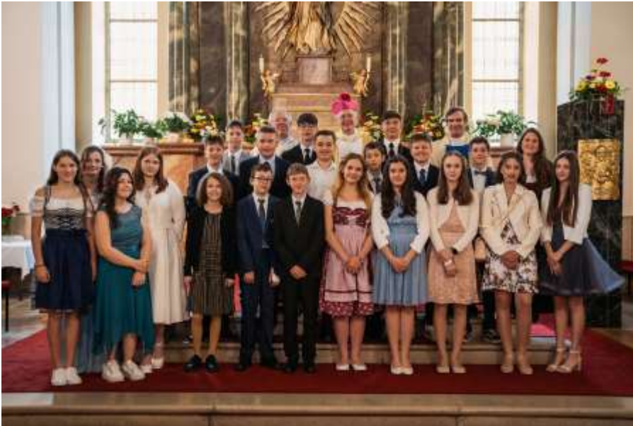
Am 24. Juni 2023 empfangen 21 Jugendliche aus dem Seelsorgeraum das Sakrament der Firmung.