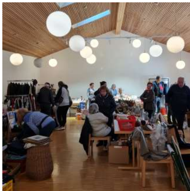
Die 13 Aussteller des Flohmarktes boten ein breites Warensortiment