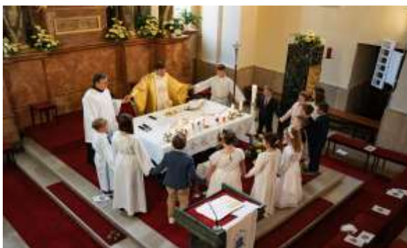
Beim Vater Unser dürfen sich die Erstkommunion-Kinder um den Altar versammeln