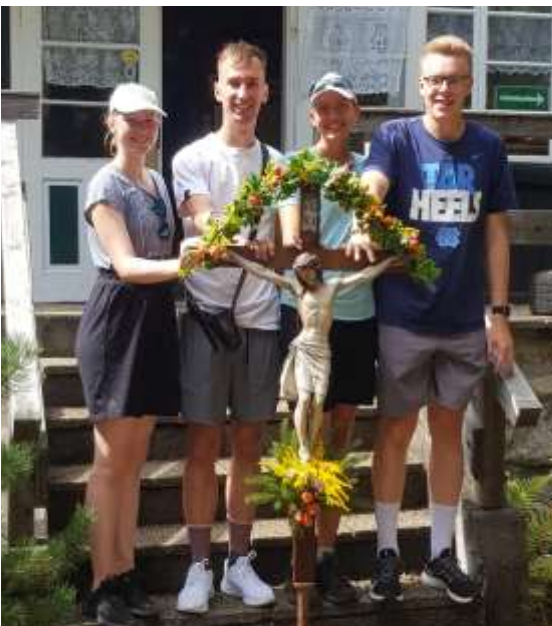
Die Jugend mit dem Wallfahrer-Kreuz

es, das Gebet auf Zunge und Herzen, das die Wallfahrt sehr bereichert, über Gutenstein in das Blättertal zum Wurzelweg, der uns zur Kirche am Mariahilfberg bringt.