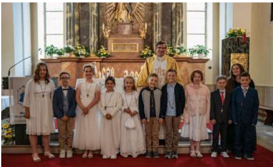
Strahlende Gesichter nach dem großen Fest

Zehn Kinder haben dieses Jahr zum ersten Mal Jesus in der Heiligen Kommunion empfangen.