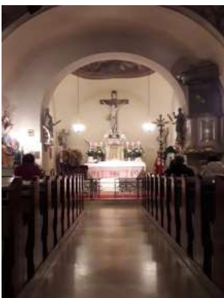
Der stimmungsvolle Ort der Anbetung

Diese Atmosphäre konnte man am 21. Oktober in Furth spüren.