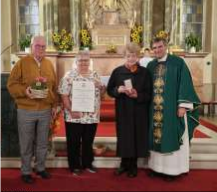
Verdiente Ehrung an unsere Organistin