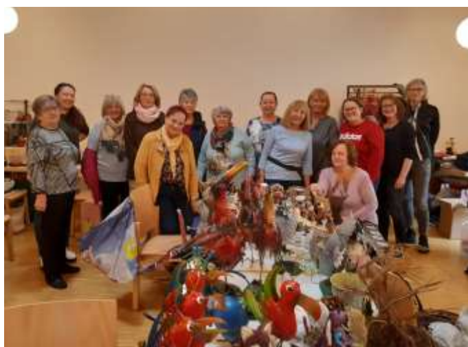
Ein gutes Miteinander der Ausstellerinnen prägte die Atmosphäre des ersten Pfarrflohmarktes in Weissenbach

Bei schönem Wetter fanden am ersten November-Wochenende viele interessierte Menschen den Weg ins Pfarrheim.