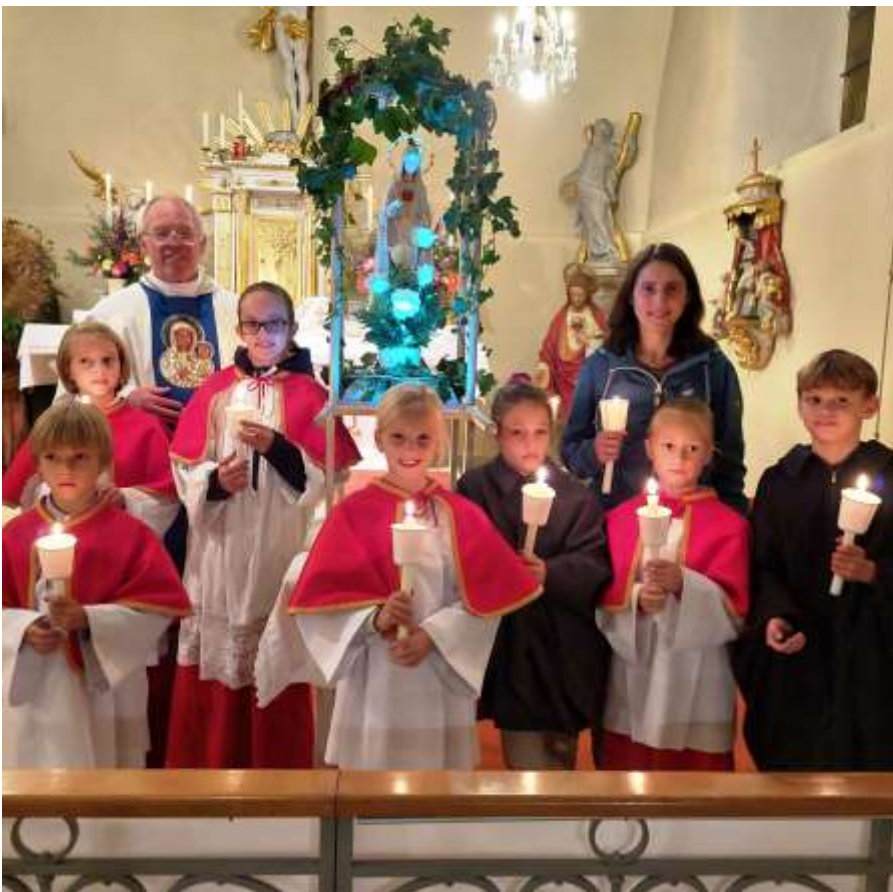
Die Lichterprozession zur Reischer-Kapelle gefiel den Ministranten besonders gut.