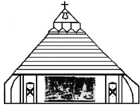
Hochstraß - Schwabendörfl