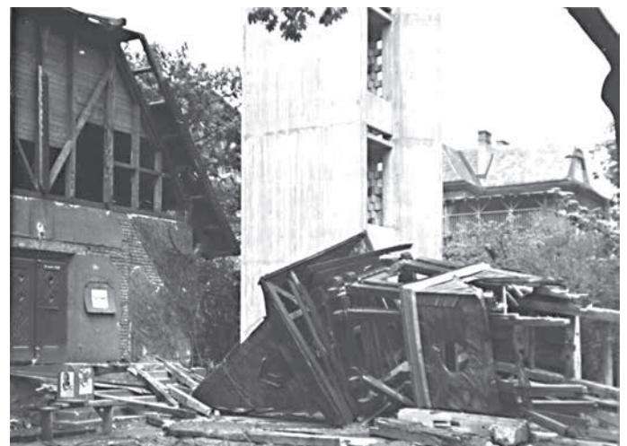
Die alte Holzkirche wird abgerissen, dahinter steht schon der neue Turm.