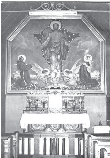
Der Hauptaltar der alten Kirche mit dem Bild „Salvator Mundi“, das nun in der neuen Kirche hängt.

Ursprünglich stand die kleine Holzkirche im Zehnten Wiener Gemeindebezirk, nahe der Spinnerin am Kreuz. Sie war dort Gottesdienststätte in einem von ukrainischen Kriegsgefangenen gegen Ende des Ersten Weltkrieges errichteten Barackenlager für Kriegsverwundete. Ab Mitte der 1920er-Jahre gab es Pläne, eine eigene Kirche für das Gebiet Am Schüttel zu errichten, da der Weg