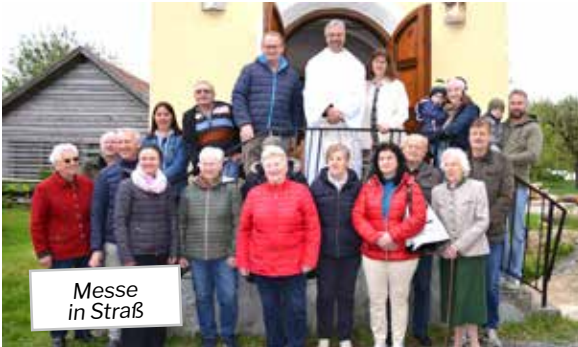
Messe in Straß