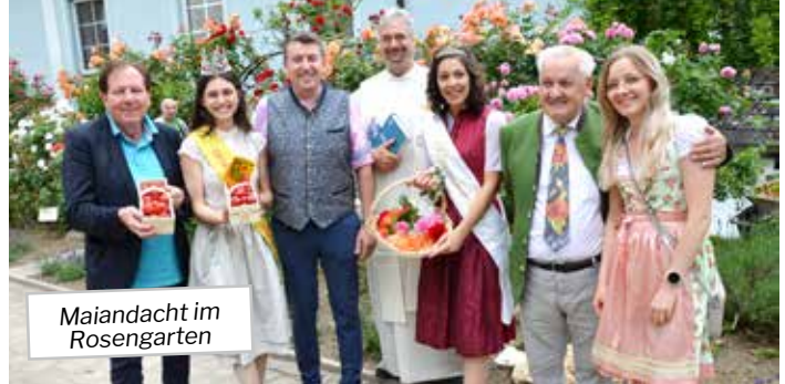
Maiandacht im Rosengarten