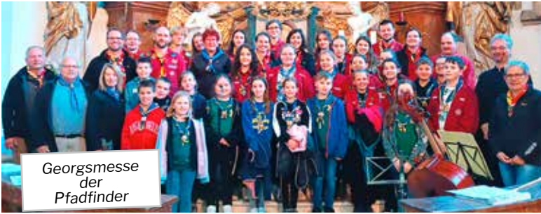
Georgsmesse der Pfadfinder