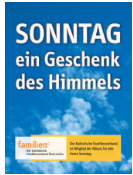
Über 50 Mitgliedsorganisationen wie der Katholische Familienverband oder Gewerkschaften engagieren sich in der Allianz für den freien Sonntag für den Schutz dieses besonderen Tages.