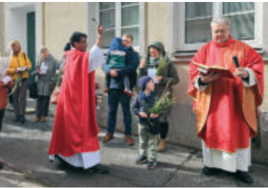
Palmweihe mit der slowenischen Gemeinde