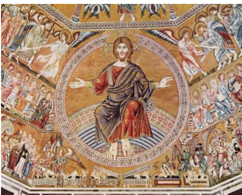
Christus Pantokrator und das Jüngste Gericht, Mosaik im Baptisterium San Giovanni/Florenz

Das Fest betont nach den Umwälzungen infolge des Ersten Weltkriegs und dem Ende großer Monarchien die wahre Königsherrschaft Christi. Die Christkönigsverehrung steht als Variante des Messianismus im Spannungsfeld zwischen Frömmigkeit und Politik. Das Fest soll die Königsherrschaft Gottes betonen, ohne dabei in eine exaltierte Beanspruchung weltlicher Macht zu gelangen. Daher ist das Fest einerseits mit dem Königtum Jesu Christi über das Volk Gottes (Israel) verknüpft, aber auch mit der Passion Christi: „Pilatus fragte ihn: Bist du der König der Juden? Er antwortete ihm: Du sagst es“ (Lk 23,3).