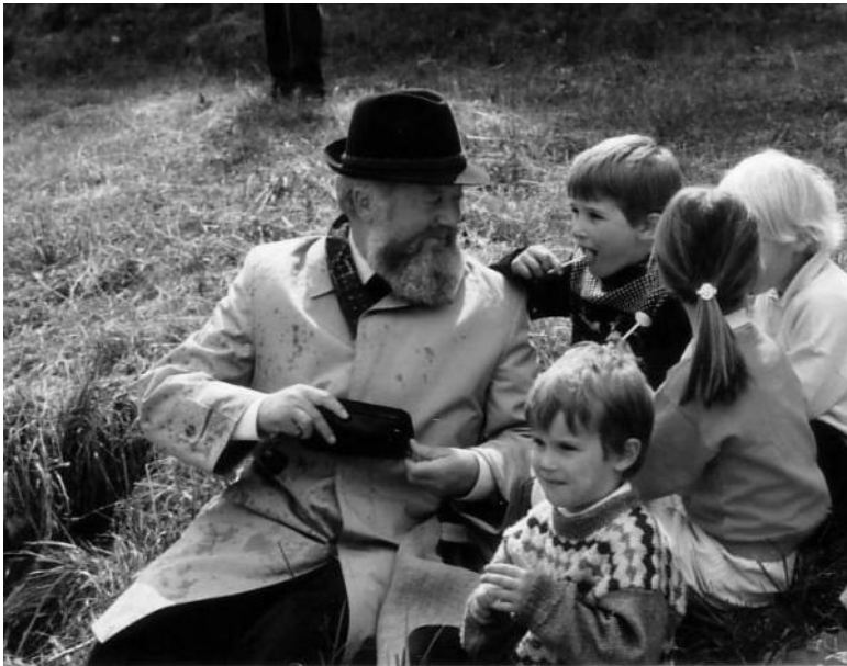
Mit Kindern beim Ausflug des Kirchenchors 1986

Bereits 1968 wurde in der Pfarre ein Flüchtlingspaar aus der Tschechoslowakei aufgenommen. Die Integration von Flüchtlingen war ihm sehr wichtig. Als 1980 im Zuge der Flüchtlingsströme aus Kambodscha