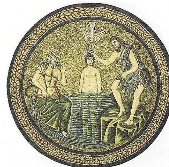
Taufe Jesu/Mosaik c. a. 520 n. C./Ravenna

Ich habe bei der Predigt am darauffolgenden Sonntag diese Thematik angesprochen. Natürlich konnte ich nur einen kleinen Teil wiedergeben. Daraufhin sprach mich eine Frau an und meinte, ich sollte darüber auch in den In-News schreiben. Ich möchte nur einen Aspekt vom gemeinsamen Priestertum aller Getauften bringen: