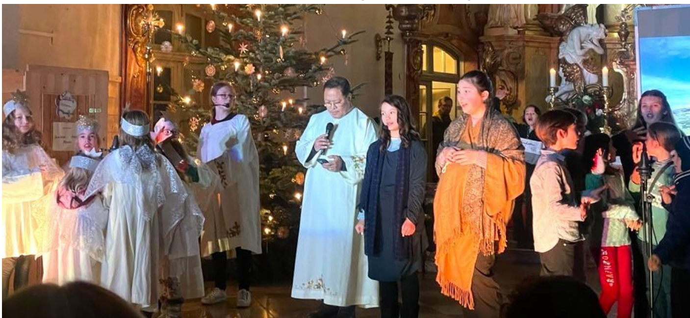
Lied: Meine Seele preist die Größe des Herrn