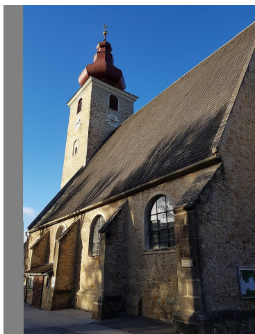
Maria Anzbach erwartet uns