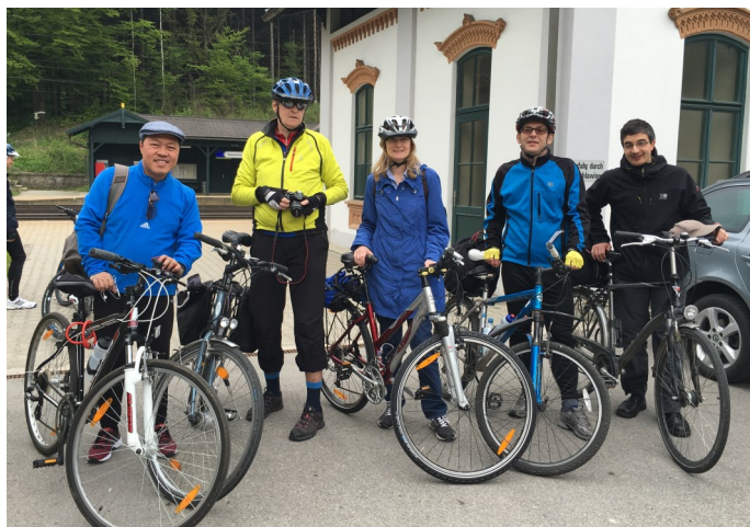
Freuen sich auf Verstärkung am 1. Mai: begeisterte Rad-Wallfahrer