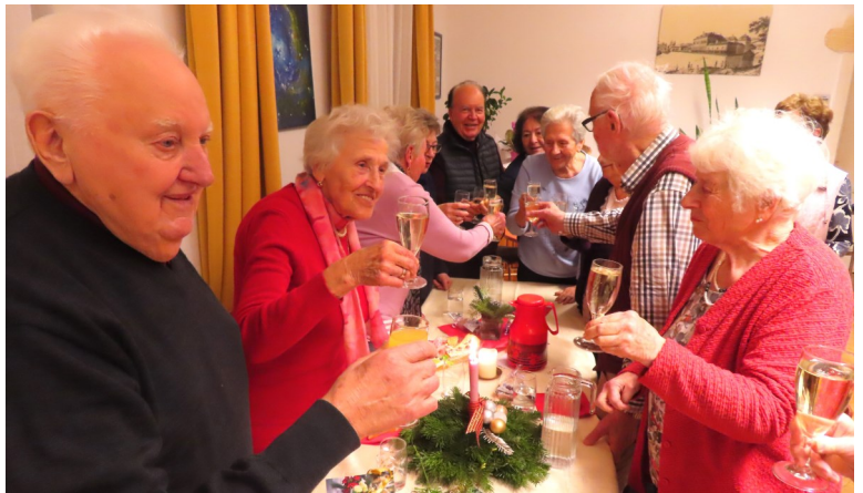
Silvester: „Prosit 2024!“