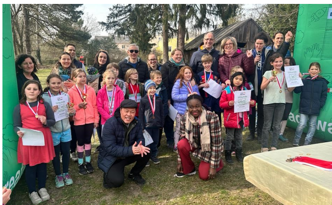
Urkunden und Pokale warten schon auf eifrige Läufer und Sponsoren!

hoffentlich Euro spenden. So kann etwa eine Schülerin, die 5 km läuft, gemeinsam mit ihrem Sponsor, der 4 €/km spendet, 20 € für Kinder und Jugendliche in Not „erlaufen“.