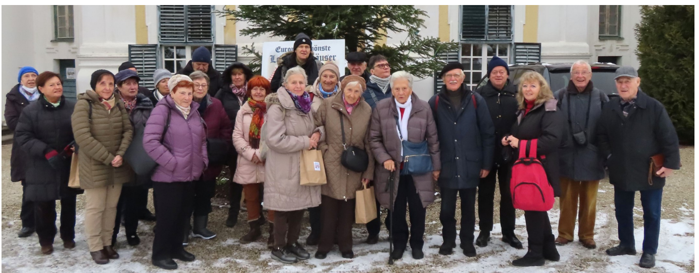
Vor der Taverne...