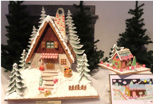
Im Dorf der Lebkuchenhäuser