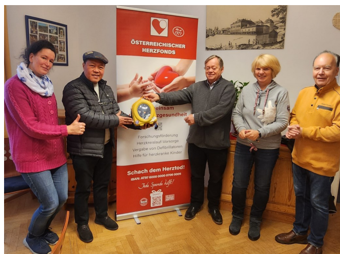
Geschulte Ersthelfer in Mariabrunn