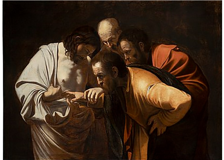
Der ungläubige Thomas von Caravaggio (1601/02, Öl auf Leinwand, 118x156,5 cm, Privatsammlung, Florenz)

In Europa gilt Thomas als Schutzpatron der Architekten, Zimmerleute, Steinhauer und Religionsgelehrten. Mit seinem Festtag, dem Thomastag, am 21. Dezember sind