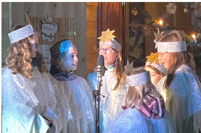
Die kleinen Engel unterstützen den Engel Gabriel