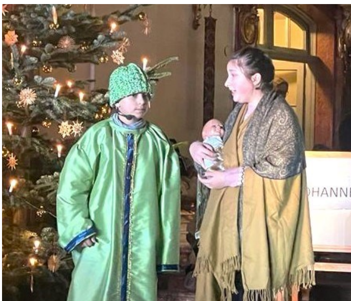
Zacharias und Elisabeth mit dem kleinen Johannes