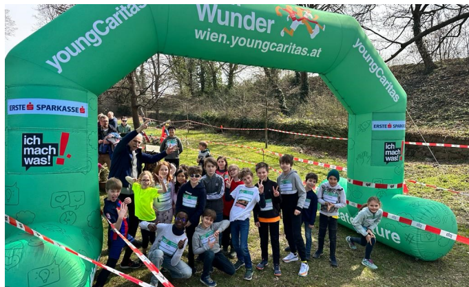
Lauf mit beim LaufWunder 2024!

den Kategorien Kindergarten, Volksschule, Unterstufe, Jugendliche 15+, Erwachsene, Senioren 60+ Startschuss in der 10 Uhr-Familienmesse mit Gottes Segen fürs Leben (Sportkleidung erwünscht!) 11.15 Uhr Start der Lauf-Runden im Pfarrgarten ab 12.15 Uhr laden wir zur Siegerehrung mit Urkunden für alle Teilnehmer und