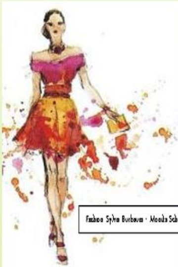
Frederic Sybra Burbanck - Modellsch