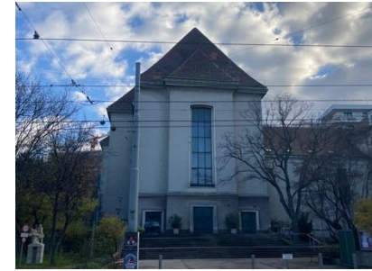
Kościół – stan obecny.

04. i 05. grudzień 1954: Konsekracja kościoła przez kardynała Theodora Innitzera.