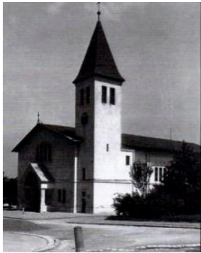
Kościół prowizoryczny, widok od zewnątrz 1905. (Hans W. Bousska, Wien 12 – Meidling. Ein Bildbogen, 2021, S. 18.)

1901: założenie oddziału wspólnotowego w powszechnym wiedeńskim stowarzyszeniu na rzecz budowy kościołów (der Allgemeine Wiener Kirchenbauverein) w celu zgromadzenia środków potrzebnych na budowę kościoła.