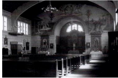
Kościół prowizoryczny, widok od wewnątrz 1905.

01. stycznia 1906: założenie parafii Neumargareten przez wiedeńskiego arcybiskupa Antona Josefa Gruschę.