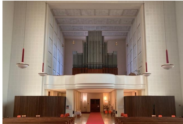
Wnętrze kościoła z widokiem na nową zakrystię.

2022: Wybudowanie i poświęcenie nowej zakrystii