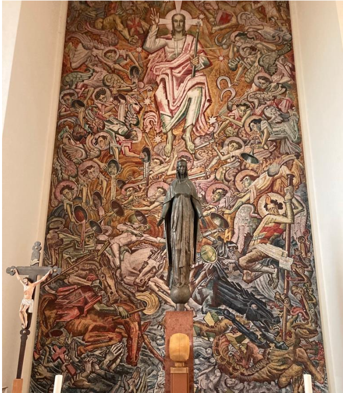
Rzeźba Matki Boskiej Niepokalanej przed obrazem ołtarzowym.