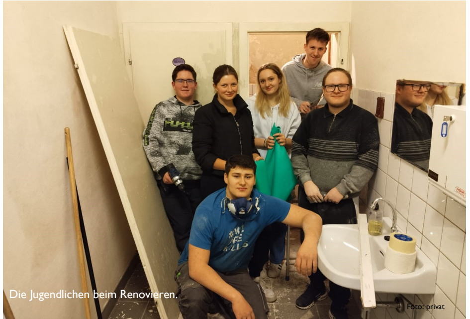
Die Jugendlichen beim Renovieren.

Die Jugend trat an den PGR mit der Frage heran, ob es eine andere Möglichkeit bzw. einen größeren Raum in der Pfarre gibt, den sie nutzen können. Nach einigen Überlegungen und längerer Diskussion in der Pfarrgemeinderatssitzung wurde schließlich in einem Rundlaufbeschluss ohne Gegenstimme vom