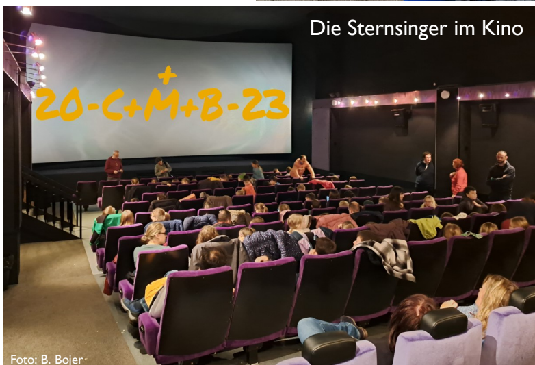
Die Sternsinger im Kino