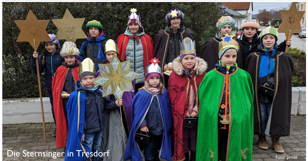
Die Sternsinger in Tresdorf