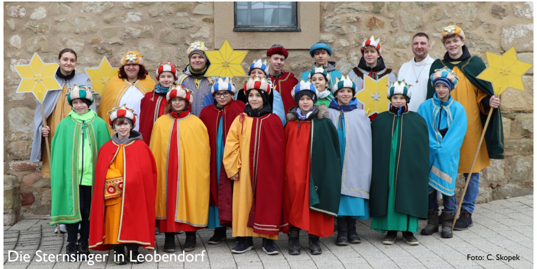
Die Sternsinger in Leobendorf

Als Dankeschön gab es, neben unzähligen Süßigkeiten, auch einen Kinobesuch in Stockerau, zu dem die Katholische Jungschar alle Sternsinger einlud. PAss Bernd Bojer