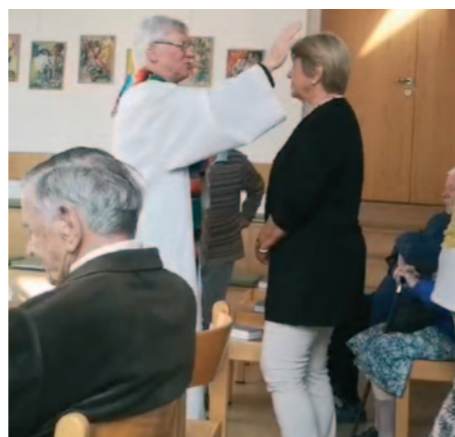
Geburtstagsmesse. Die Einladung zur traditionellen Geburtstagsmesse, mit persönlichem Segen für die Jubilare, wurde auch heuer wieder sehr gut angenommen!