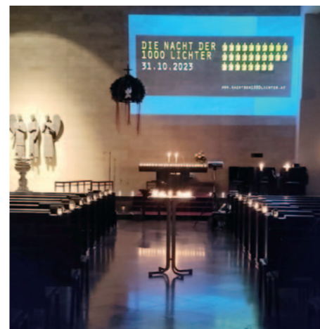
Nacht der 1000 Lichter. Drei Stunden war unsere Pfarrkirche am Abend des 31. Oktober 2023 geöffnet, um im Rahmen der „Nacht der 1000 Lichter“, ein Innehalten bei Kerzenschein, Musik und textlichen Impulsen zu ermöglichen.