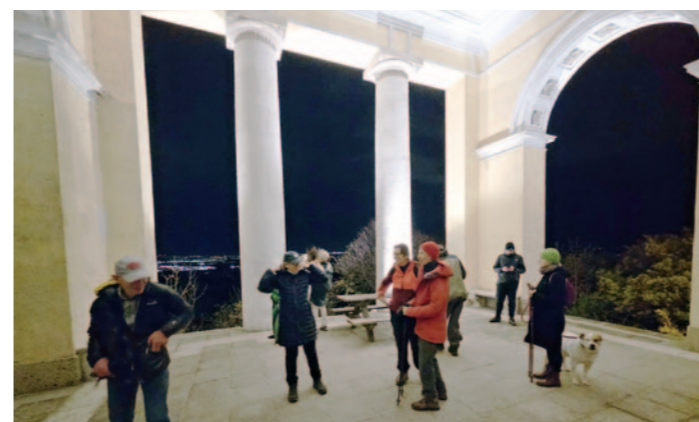
Nachtwanderung. Trotz Wind und Regen brachen zehn Personen zur traditionellen Nachtwanderung auf den Husarentempel am 2. November 2023 auf. Bei Gedanken, auf welche Weise Jede und Jeder persönlich Licht in die Welt bringen kann, erreichte die Gruppe den Husarentempel, der noch für einen kurzen Augenblick im Licht erstrahlte.