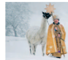
STERNSINGEN Mach mit!

Wenn beim Sternsingen alle einen Schrittzähler mithätten, würden sie gemeinsam den Erdkreis locker umrunden. Jeder Schritt von Caspar, Melchior und Balthasar, jede Mithilfe beim Sternsingen ist ein großartiger Beitrag, um die Welt besser zu machen. Bereits zum 70. Mal bringen die Sternsinger*innen heuer die weihnachtliche Friedensbotschaft für das neue Jahr zu den Menschen im Land. In der Pfarre Hinterbrühl werden die Sternsinger*innen am 6. Jänner und am 7. Jänner unterwegs sein, und den Segen in die Wohnungen und Häuser bringen.