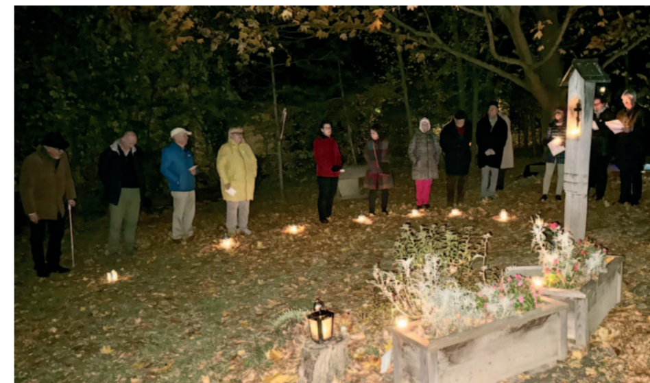
KZ-Gedenkstätte. Der Abend des 1. November ist jedes Jahr ein ausdrucksstarkes Zeichen für Frieden und Versöhnung – im Zusammentreffen und Erinnern bei der KZ-Gedenkstätte an der Johannesstraße.