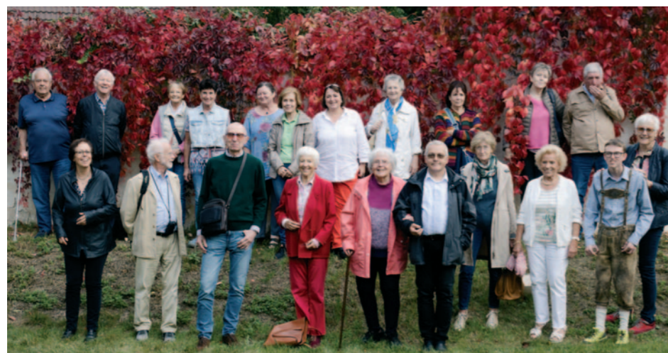
Pfarrausflug. Zu einem Ausflug anlässlich des 40-Jahr-Jubiläums unseres „Haus Brühl“ in Götzweis brach eine kleine Schar von Pfarrmitgliedern auf und verbrachte einen schönen gemeinsamen Tag.