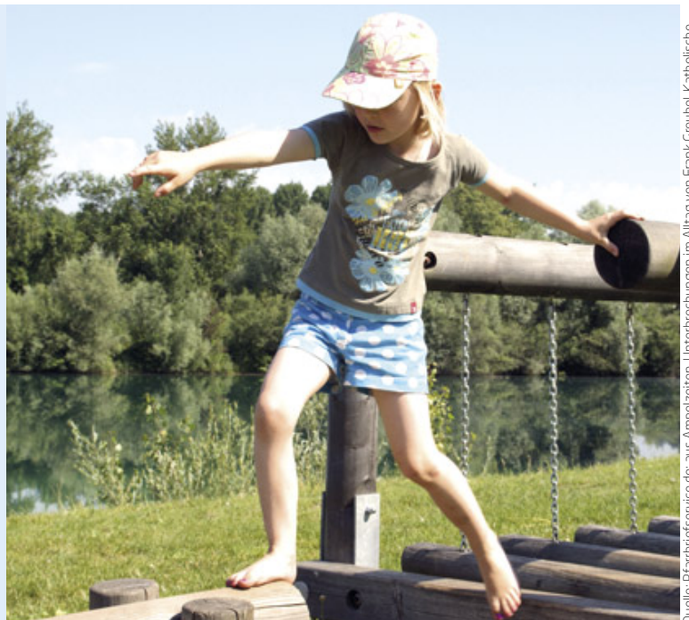
Quelle: Pfarrbriefservice.de; aus Anzeigen, Unterbrechungen im Alltag von Frank Creubel, Katholische Landvolkbewegung Würzburg. Bild: Martin Manigatterer/Pfarrbriefservice.de