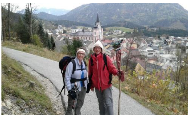
Ankunft in Mariazell

Der täglich gestaltete Morgen mit Lied, Gebet oder Texten begleitete unseren Tag. Die Zeit der Stille einmal pro Tag schenkte uns die Wahrnehmung, um nach innen hören zu können. Wir ließen uns hin-