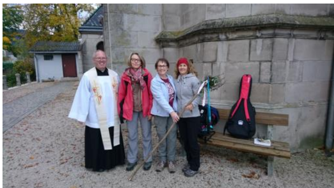
Aufbruch mit und unter dem Segen Gottes

Wallfahren und Pilgern sind trotz vieler Gemeinsamkeiten zwei verschiedene Ansätze: Wallfahren stellt die katholische Tradition dar, kann nicht nur zu Fuß oder mit dem Rad, sondern auch mit dem Auto, Bus oder sogar Flugzeug durchgeführt werden und umfasst meist Rituale und Formen wie das Rosenkranzgebet und den Empfang von Sakramenten, was zudem oft in Gruppen geschieht.