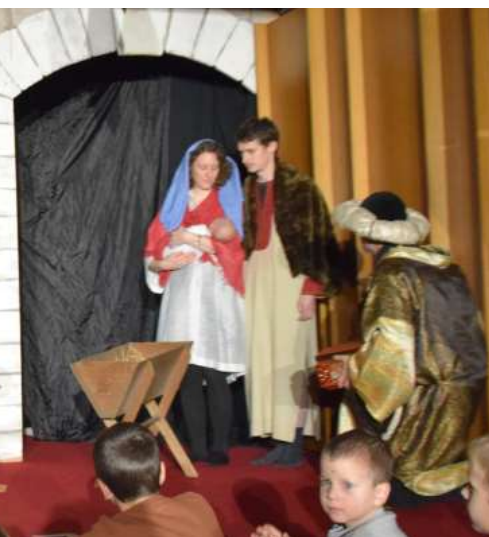
Oben: Die Weisen aus dem Morgenland rasten bei einem redseligen Wirten.