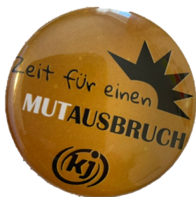
Anstecker für die Jugendlichen