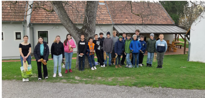
Ratschergruppe Stetteldorf am Wagram