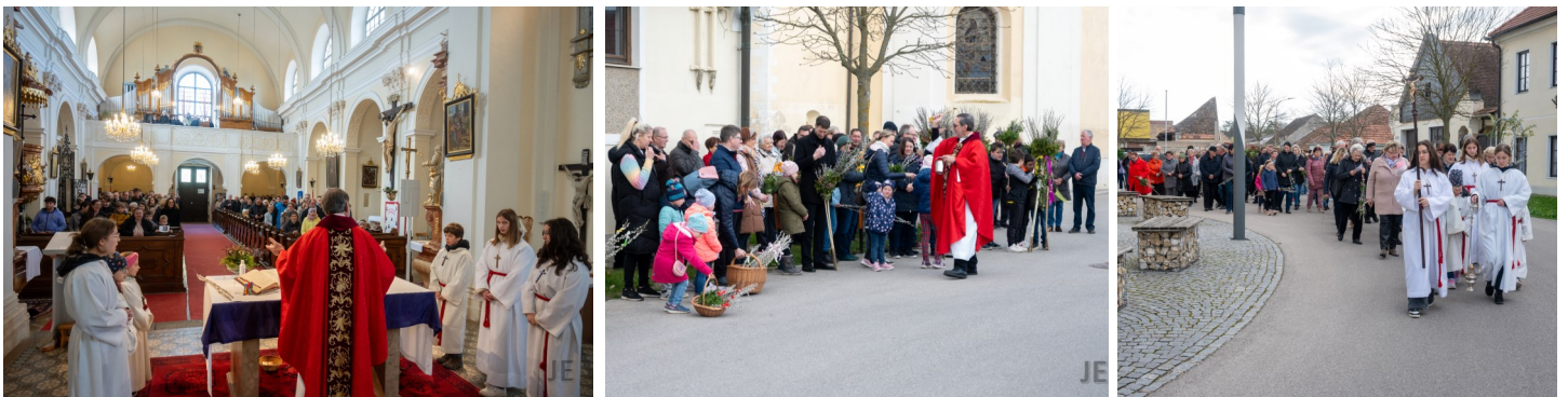
Palmsonntag - gemeinsames Beten in der Kirche, Palmbuschenweihe und Umzug vor der Kirche