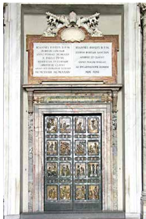
Die Heilige Pforte im Petersdom wird nur in Heiligen Jahren geöffnet.

An die 45 Millionen PilgerInnen werden im Heiligen Jahr in Rom erwartet. Nicht nur Einzelpersonen, auch viele Gruppen aus Diözesen, Pfarren und andere Gruppierungen und Organisationen planen für das