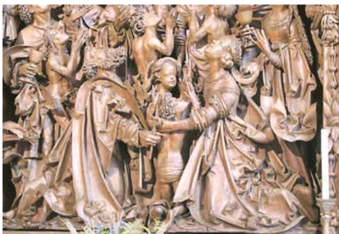
Der mehr als 500 Jahre alte, geschnitzte Altar ist eine besondere Sehenswürdigkeit (Ausschnitt).