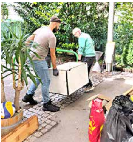
Viele freiwillige HelferInnen waren bei den Aufräumarbeiten dabei.

als wäre ein Hydrant geplatzt, begann sich das Wasser seinen Weg ins Haus zu bahnen. Binnen weniger Minuten hatte sich die gesamte Toilette-Anlage gänzlich gefüllt, unter der durch das Wasser von innen verbarriadierten Tür drückte sich Welle um Welle in Vorraum und Pfarrsaal, bis beide knietief unter Wasser standen und sich wiederum in den Keller entleerten, wo der Pegel schließlich einen Höchststand von 1,60 Meter erreichte und dort ungehindert beginnen konnte, großen Schaden zu verursachen.