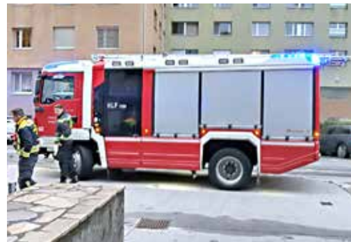
Die Feuerwehr musste den Keller auspumpen.

Wie leider in solchen Katastrophensituationen üblich, trat das wahre Ausmaß erst später, nach wiederum vielen Stunden Tragens, Trocknens und Sortierens zu Tage. Fazit: Zwei kaputte Heizungen, eine komplett zu erneuernde Toilette-Anlage, eine durchgebrannte Telefonanlage, ein auf Wochen