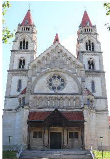
100 Jahre Pfarre Donaustadt 1921 - 2021

Und weitere 50 Jahre später haben wir wieder um 10 Uhr gefeiert, aber diesmal ein Pontifikalamt mit Seiner Eminenz Christoph Kardinal Schönborn. Da die Pfarre vom Trinitarierorden betreut wird, fand die Jubiläumsfeier am Dreifaltigkeitssonntag, dem 30. Mai 2021 statt.