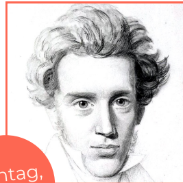
Søren Kierkegaard 1813 – 1855