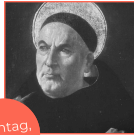
Thomas von Aquin 1225 – 1274