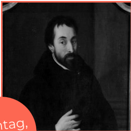
Friedrich Spee 1591 – 1635