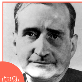
Reinhold Schneider 1903 – 1958