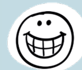
PLATZ FÜR IHREN VORSCHLAG