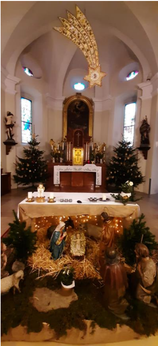
Die festlich geschmückte Pfarrkirche mit Krippe, Stern und Christbäumen.

Ein herzliches „Vergelt's Gott“ der Feuerwehrjugend für das Friedenslicht aus Bethlehem, das am 24.12. bei der Rorate überbracht wurde. Ein Dankeschön auch allen, für die Vorbereitung der stimmungsvollen Roratemessen und den Glaubenszeugnissen sowie all jenen, die nach den Roratemessen für ein Frühstück gesorgt haben.