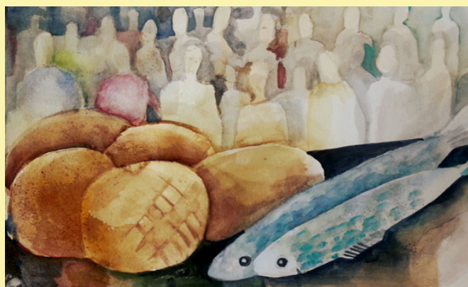
Speisung der 5000

wurde Zeit fürs Abendessen. Soll ich mein Essen aus der Tasche holen? Aber was ist, wenn mein Sitznachbar nichts oder wenig mit hat, dann will er von meinem Essen und ich habe vielleicht zu wenig. Nur der kleine Junge, ein