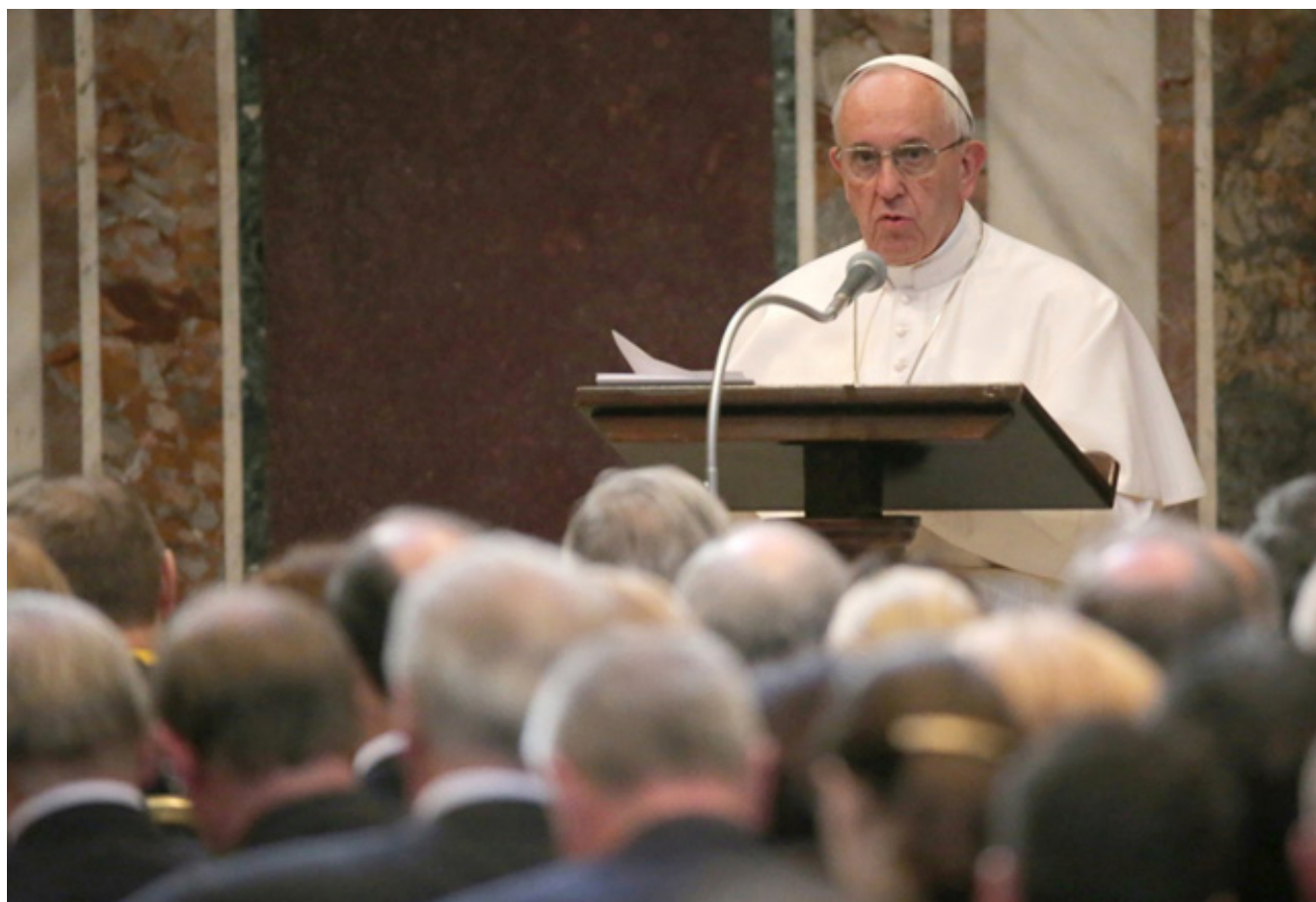
Papst Franziskus bei seiner Rede anlässlich der Verleihung des Karlspreises

Zwei Drittel der Einwohnerinnen und Einwohner Europas (einschließlich Großbritanniens) leben in Ländern, die sich zur Europäischen Union zusammenschlossen. Europa ist also deutlich mehr als nur die EU!