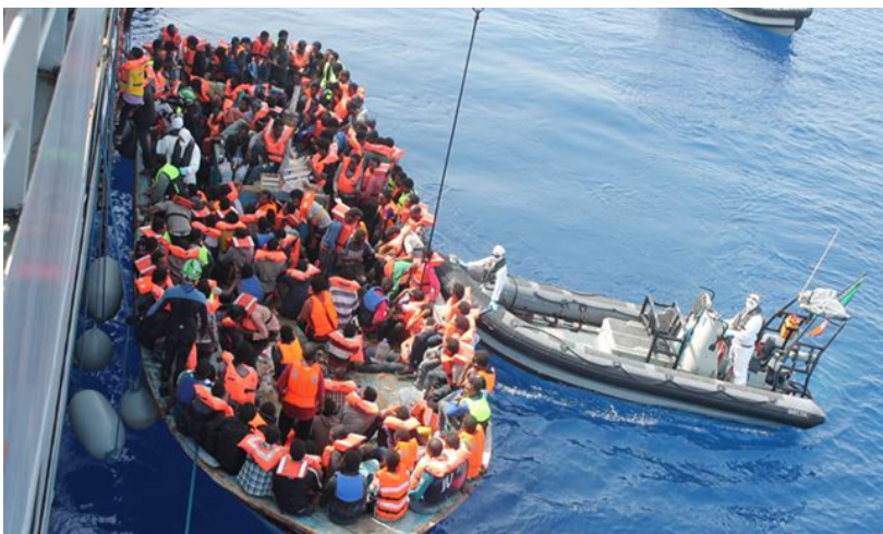
Flüchtlinge im Mittelmeer, ein Gradmesser für europäische Solidarität

Merkels Botschaft deckt sich mit der von Papst Franziskus, der bei der Karlspreisverleihung gemeint hat: „Wenn es ein Wort gibt, das wir bis zur Erschöpfung wiederholen müssen, dann lautet es „Dialog“. (...) Die Kultur des Dialogs schließt einen echten Lernprozess sowie Askese ein. Eine Askese, die uns hilft, den Anderen als ebenbürtigen Gesprächspartner anzuerkennen, und die uns erlaubt, den Fremden, den Migranten, den Angehörigen einer anderen Kultur als Subjekt zu betrachten, dem man als anerkanntem und geschätztem Gegenüber zuhört.“