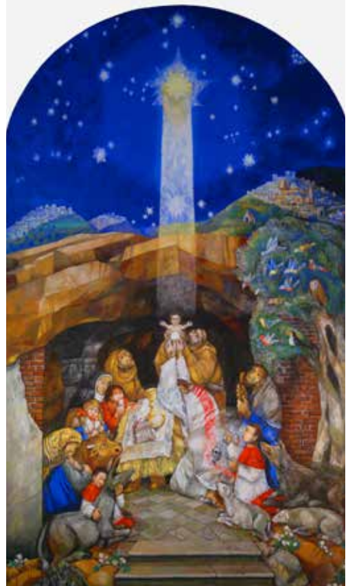
Wandbild "Weihnachten in Greccio" in der Franziskuskapelle des Kinder- und Jugenddorfs Marienpflege.

Seit der Krippe von Greccio sind weltweit unzählige, vielfältige Krippengestaltungen entstanden, ob aus Holz ge-