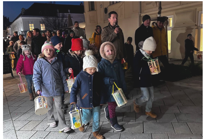
8. November 2024: Martinsumzug vom Kurpark zur Stadtpfarrkirche