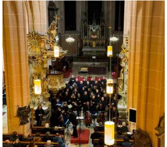
Konzert am 16. November in St. Stephan