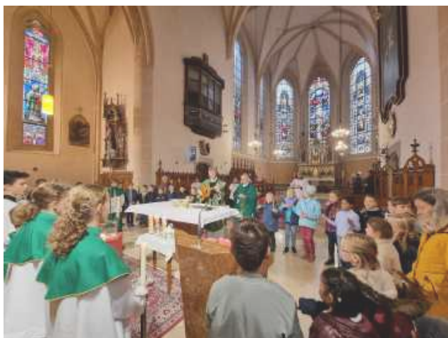
Kreis der Erstkommunionkinder um den Altar, um das "Vater Unser" zu singen