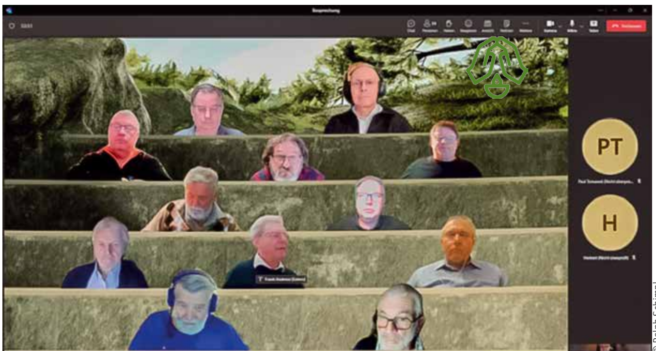
„Communio über Teams“

Das nächste Treffen findet am 26. September 2024 ab 18:30 statt. Einladungen dazu werden zeitgerecht vom Institut als E-Mail-Einladung ausgeschildet. Wir freuen uns auch, Vorschläge für Themen von den Teilnehmern zu erhalten. Wenn du ein Thema hast, das du gerne in einem zukünftigen Treffen diskutieren möchtest, teile es uns bitte mit: diakonaton@edw.or.at Betreff: Diakone Online