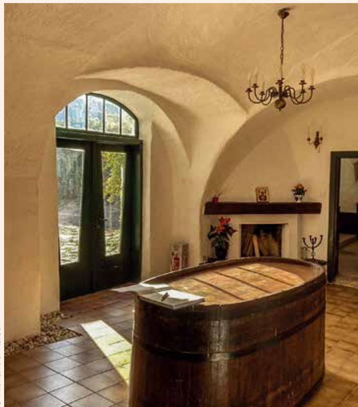
Der Eingangsraum des Berufungszentrums Wachau