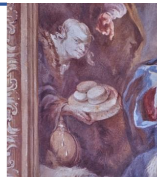
Selbstbildnis als Hirte an der Krippe (Pfarrkirche Sümeg, 1758)

Die Ausstellung Franz Anton Maulbertsch und die Piaristen wird im Rahmen der Langen Nacht der