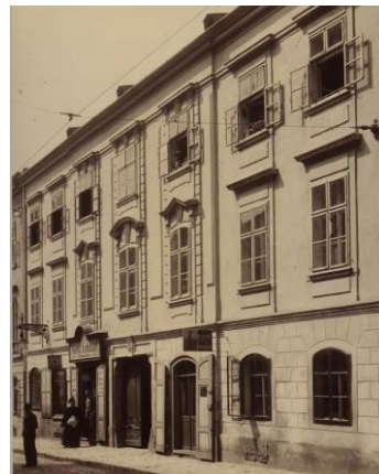
Wohn- und Sterbehaus Franz Anton Maulbertschs, an der Stelle des heutigen Hauses Piaristengasse 11

Maulbertsch war aber nicht nur als Maler, sondern auch als Graphiker für die Piaristen tätig. Auf eigens angefertigte Vorlagen von ihm gehen neun Radierungen Jakob Schmutzers zurück, die als Neujahrgabe für die Mitglieder der Johann Nepomuk-Bruderschaft an der Kirche Maria Treu geschaffen wurden. Sie zeigen Bilder aus dem Leben des hl. Johannes von Nepomuk.