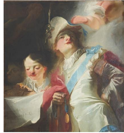
Schüler des hl. Joseph Calasanz in der Kleidung von Maulbertschs Zeit, einzig erhaltener Rest aus dem Calasanz-Altarbild Maulbertschs in Maria Treu, Privatbesitz Wien

In der Folge malte Maulbertsch für die Kirche noch das Hochaltarbild, das Bild des dem Ordensstifter Joseph Calasanz geweihten großen linken Seitenaltars und die Gemälde der beiden vorderen Seitenaltäre zu Ehren des heiligen Johannes von Nepomuk bzw. mit der Darstellung der Kreuzigung Christi. Nur letzteres – ein Geschenk des Malers für die Kirche – ist erhalten, die drei anderen Altarbilder wurden im zweiten Viertel des 19.