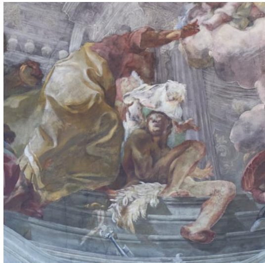
Heilung des Gelähmten durch den Schatten des Petrus (Detail aus dem Deckenfresko in Maria Treu, gestaltet von Franz Anton Maulbertsch 1752)

Am Samstag, 8. Juni laden wir um 10:00 zur Krankmesse in die Schmerzenskapelle. Im Rahmen dieser