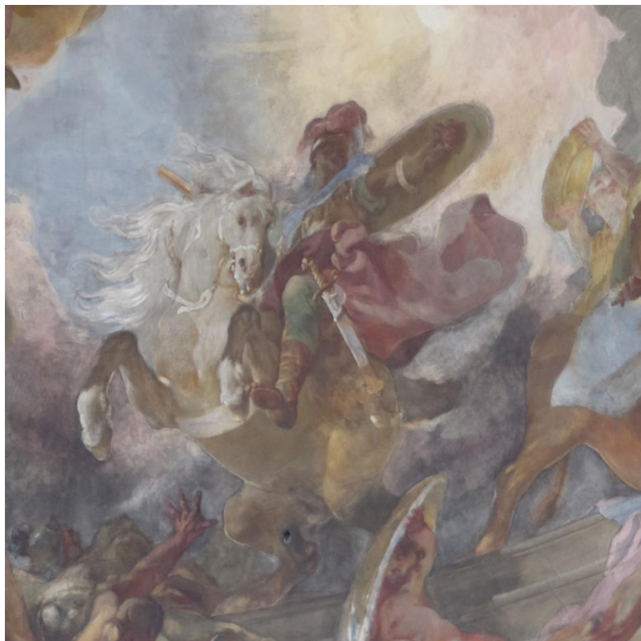
Franz Anton Maulbertsch (* 1724): Josuah aus dem Deckenfresko der Hauptkuppel in Maria Treu

Am Calasanzstand – geöffnet jeweils Mittwoch bis Sonntag 15:00 bis 21:00, am Sonntag auch nach der Gemeindemesse bis 12:00 – gibt es bis zu den Sommerferien Erfrischungsgetränke und die Möglichkeit zur Begegnung sowie den Zugang zur Ausstellung.