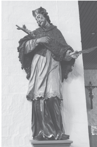
Foto: Johannes Nepomuk-Statue in Wegscheid, Niederbayern.