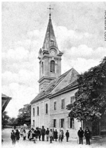
Kirche im Jahr 1900

Kirche für Kinder Sonntag, 22. September, 9:30 Uhr Kinderwortgottesdienst Alle Kinder sind herzlichst eingeladen!