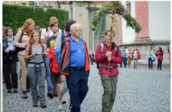
Einzug in Mariazell